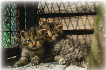
Mláďata kočky divoké

Více na www.zoo-ostrava.cz , sekce „ochrana přírody“