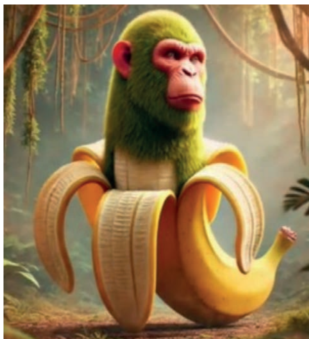
obr. Chimpanzini Bananini

Italský brain rot (doslovně v překladu hniloba mozku ), jsou absurdní obrázky s pseudoitalskými jmény vytvořené umělou inteligencí. Šíří se všemi sociálními sítěmi, nejvíce pak přes Instagram nebo TikTok. Obecně je pak brain rot triviálním obsahem bez smyslu a zabíjením času při nadměrném brouzdání internetem vede k útlumu a rozkladu duševního nebo intelektuálního stavu. Může vypadat jako neškodná legrace, vtip a popuštění uzdy fantazii – jak by asi vypadal šimpanz křížený s banánem?